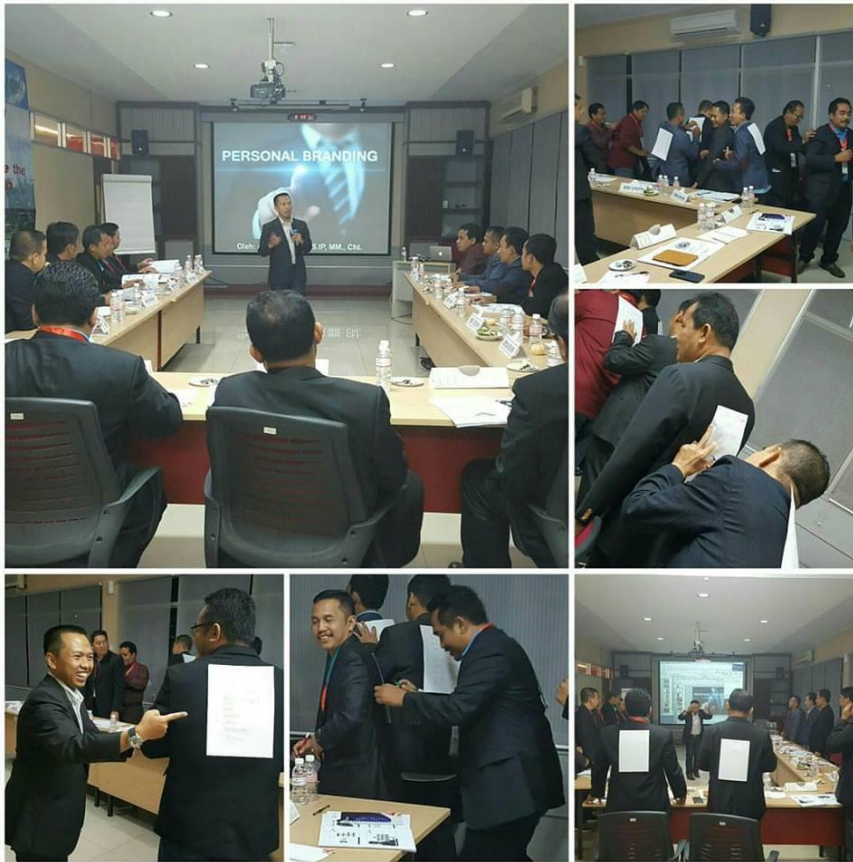
Gambar : Training Personal Branding di Workshop Perusahaan Agen Property

Menjadi dikenal adalah upaya promosi produk, jasa hingga memperkenalkan personal dalam rangka peningkatan promosi dan nilai pribadi. Promosi yang dilakukan sangat erat kaitannya dengan seluruh proses membentuk merk yang khas dan dikenal.