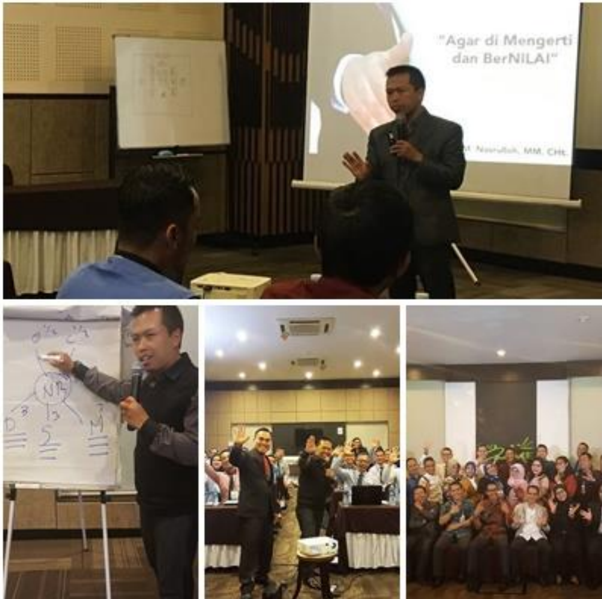
Gambar : Training Maximum Presentation

Komunikasi dan presentasi merupakan salah satu kemampuan yang sangat diperlukan pada masa kini. Sinergi usaha dan kolaborasi personal memerlukan tools komunikasi dalam mentransfer gagasan dan ide pengembangan karir dan usaha. Memiliki kemampuan komunikasi yang optimal bisa memberikan bekal termasuk nilai tambah khusus kepada pribadi dan organisasi.