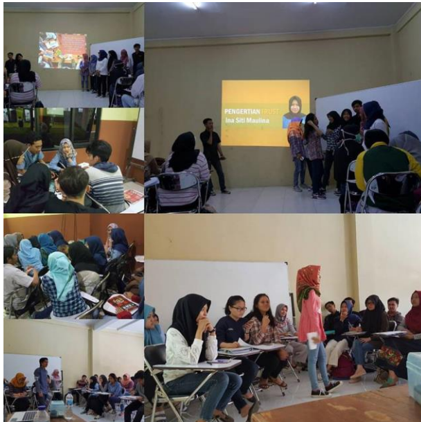
Gambar : Training Trust Building

Bekerjasama adalah keniscayaan dalam kehidupan manusia untuk mencapai kebesaran. Fitrah dasar manusia sebagai makhluk sosial ditambah dengan adanya kebutuhan untuk meningkatkan kualitas dan kuantitas kinerja menjadi alasan utama dalam peningkatan proses kerjasama membentuk Tim yang solid. Hasilnya adalah kolaborasi dan loyalitas kerjasama yang bisa mendorong kepada perbaikan kinerja secara keseluruhan.